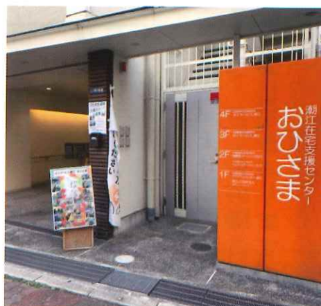
ヘルパーステーションさくら (潮江3丁目 おひさま2階)