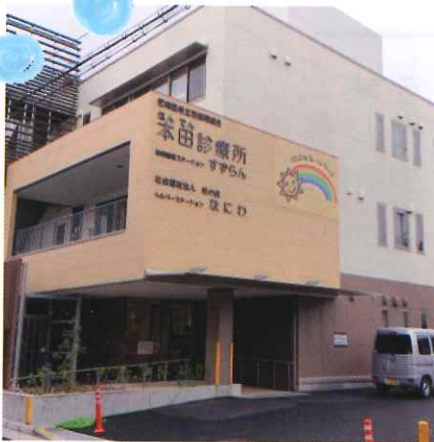
ヘルパーステーションなにわ (大庄西町2丁目 本田診療所3階)