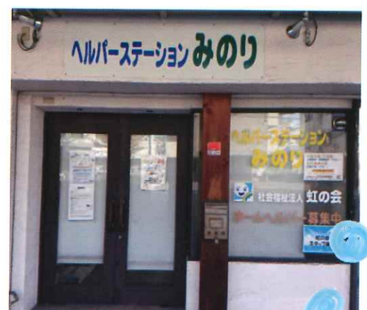
ヘルパーステーションみのり (今福1丁目 東尼崎診療所近く)