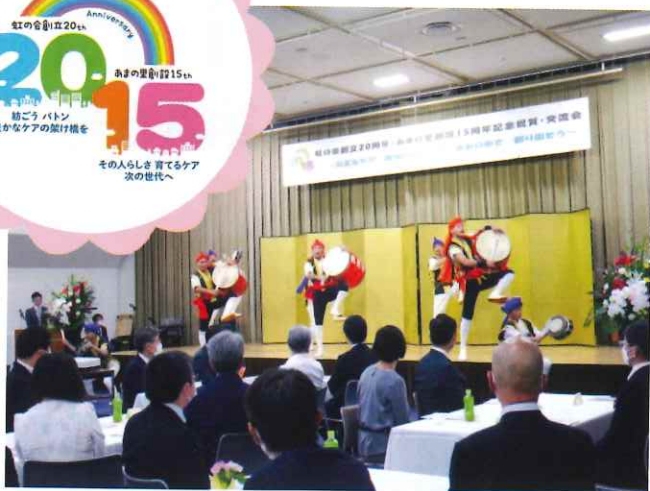
オープニングセレモニーを飾ってくださった 沖縄民族芸能「琉鼓会」さん

今年4月から3つの実行委員を中心企画を進めていました、 「虹の会創立20周年・あまの里創設15周年記念祝賀・交流会」が10月23日無事開催することができました。 コロナ禍中ということでも来賓の方々に安心して参加していただけるよう規模を縮小し感染症対策に努めました。 虹の会はじめての祝賀会の様子をお伝えしていきます。